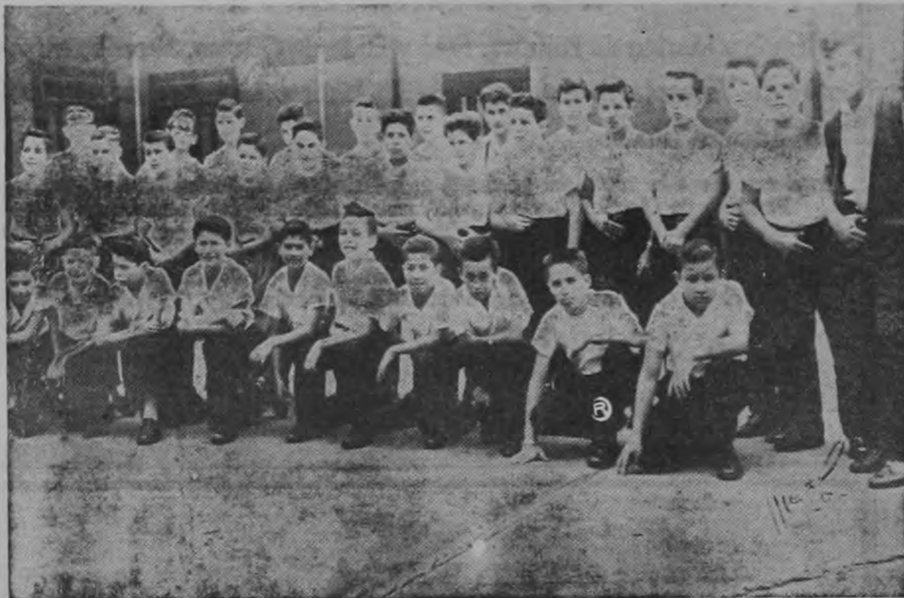
Los jovencitos del Sexto Grado C. de la Escuela Juan Rudín, quienes terminaron su curso lectivo de 1961 completando así su educación primaria